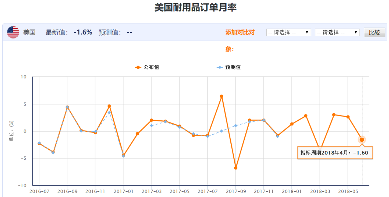
图表 1 美国耐用品订单月率